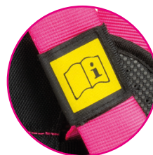
Etiqueta de producto protegida en velcro