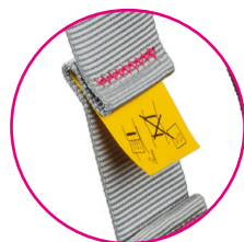
Testigos de caída