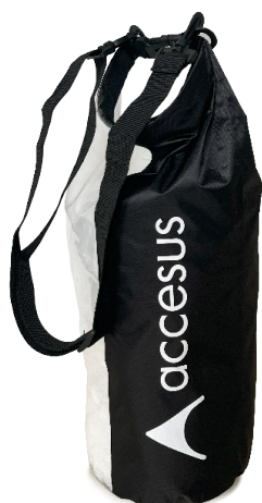
Bolsa impermeable incluida BLS-PRO