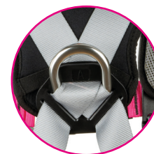
Punto de anclaje dorsal