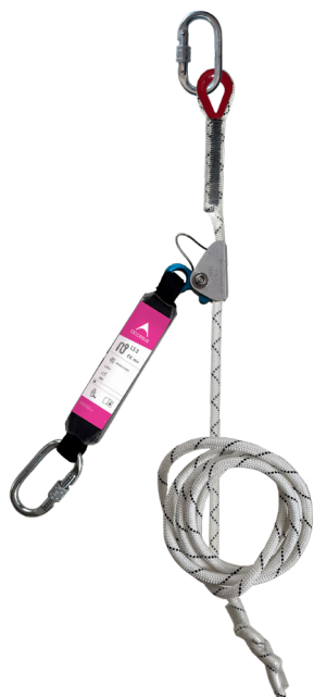
Línea de vida LS 3