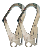
x2 conectores AA022