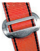
Hebilla de conexión y regulación