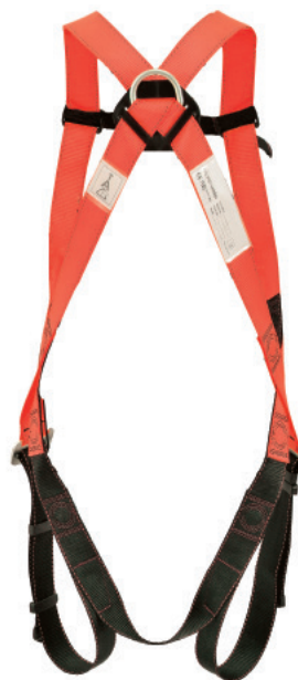
Vista trasera del arnés de seguridad A01S.