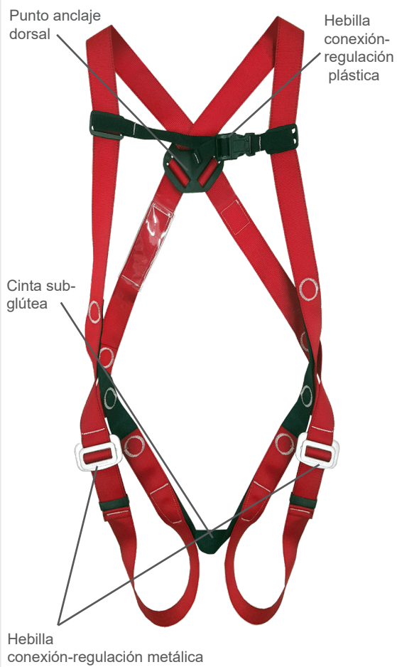
Vista frontal del arnés de seguridad A01S