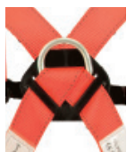
Punto anclaje dorsal