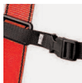
Hebilla de conexión y regulación