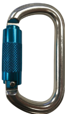
Conector desmontable. Mosquetón AA012T