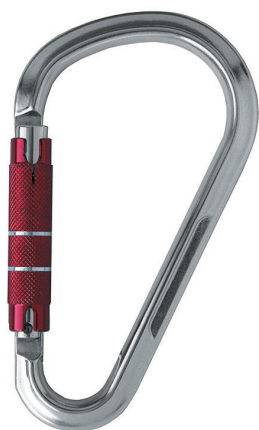
Conector desmontable. Mosquetón AA111