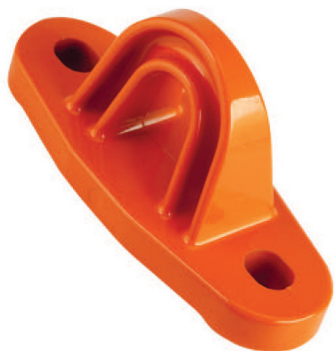
Punto de anclaje PAF150