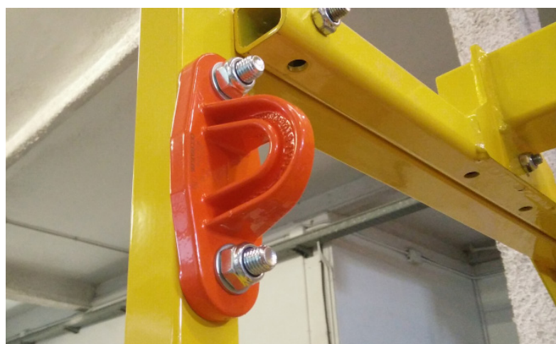
Detalle de PAF 150 en cesta para grúas CG300