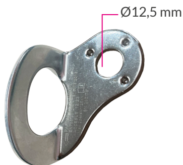
Punto de anclaje fijo para personas PAF180-12