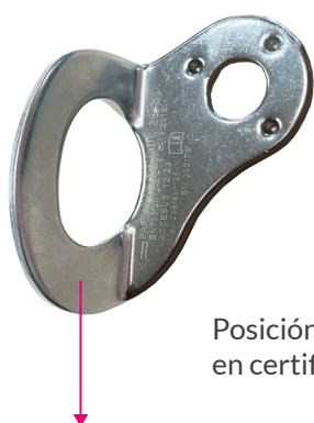
Posición admitida en certificado CE