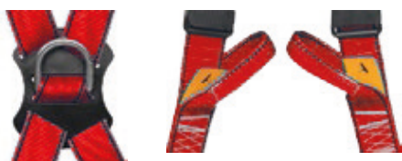
Punto anclaje dorsal