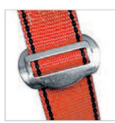
Hebilla de conexión y regulación