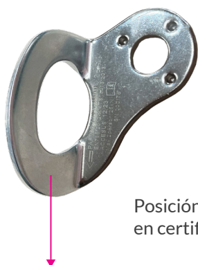
Posición admitida en certificado CE