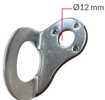
Punto de anclaje fijo para personas PAF180-12