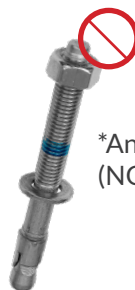
*Anclaje mecánico (NO incluido)