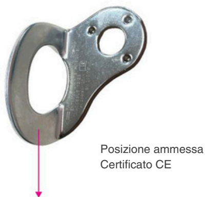
Posizione ammessa Certificato CE