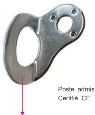
Poste admis Certifié CE