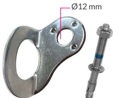
Punto de anclaje fijo para personas PAF180-12A con anclaje mecánico.