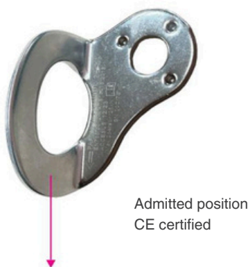
Admitted position CE certified