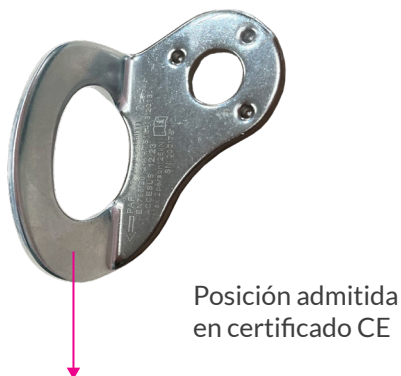
Posición admitida en certificado CE