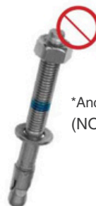
*Ancoraggio meccanico (NON incluso)