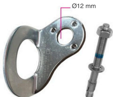
Ponto de ancoragem fixo para pessoas PAF180-12A com ancoragem mecânica.