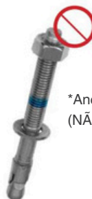
*Ancoragem mecânica (NÃO incluído)