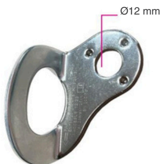
Ponto de ancoragem fixo para pessoas PAF180-12