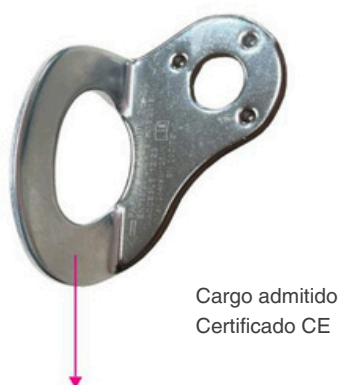
Cargo admitido Certificado CE