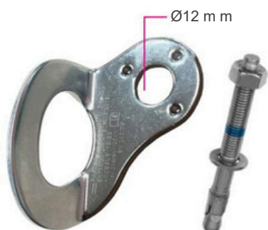
Point d'ancrage fixe pour personnes P AF18012A avec ancrage mécanique.